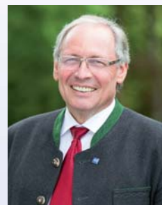
Schirmherr Anton Klotz Landrat des Landkreises Oberallgäu